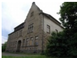
Die Ost-Fassade der ehemaligen Präparandie.