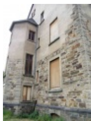
Die Südseite des ehemaligen Präparandie-Gebäudes.