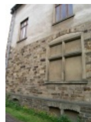
Das Gebäude der ehemaligen Präparandie-Gebäudes in östliche Richtung fotografiert.

Das Gebäude nach einer Grundmodernisierung im Frühjahr 2010.