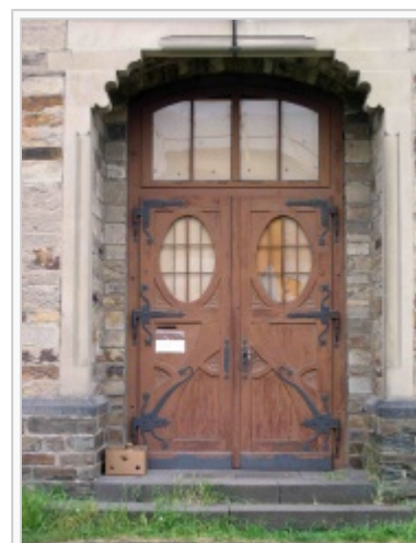
Der Haupteingang zum Gebäude der ehemaligen Präparandie.